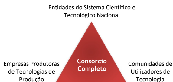
Figura 2 – Triângulo Virtuoso da Inovação Tecnológica