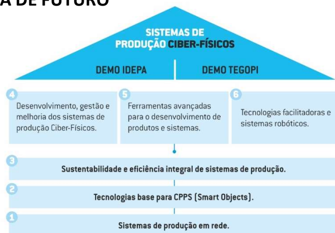
Figura 1 - Estrutura do Projeto